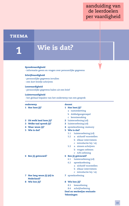
Stap 1 handleiding