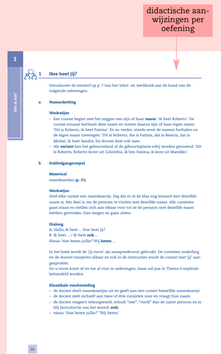
Stap 1 handleiding